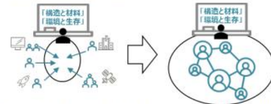
SX基盤領域発展研究の事業イメージ (文部科学省作成)