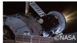
スラスタ噴射の様子 (露プログレス補給船)