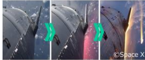
宇宙輸送機の大気圏再突入時のイメージ