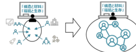
SX基盤領域発展研究の事業イメージ (文部科学省作成)