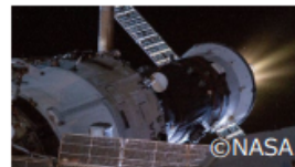
スラスタ噴射の様子 (露プログレス補給船)