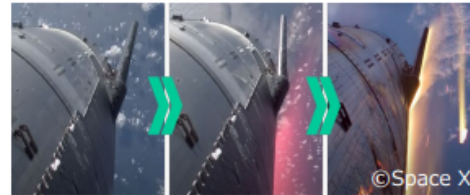
宇宙輸送機の大気圏再突入時のイメージ