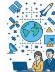
STM（宇宙交通管理）及び SSA（宇宙状況把握）のイメージ (Microsoft Copilotにより生成)