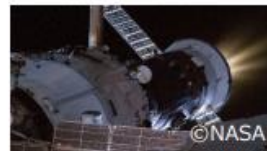
スラスト噴射の様子 (露プログレス補給船)