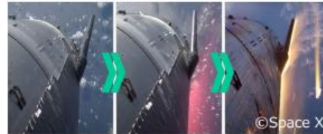
宇宙輸送機の大気圏再突入時のイメージ