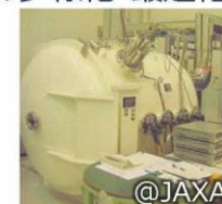
試験設備イメージ @JAXA