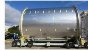
ロケット構造体のイメージ